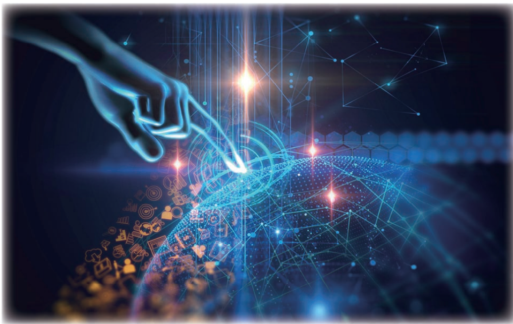
图4 感官互联：多维感官的交融响应

为了支撑感官互联的实现，需要保证触觉、听觉、视觉等不同感官信息传输的一致性与协调性，毫秒级的时延将为用户提供较好的连接体验。触觉的反馈信息与身体的姿态和相对位置息息相关，对于定位精度将提出较高要求。在多维感官信息协同传输的要求下，网络传送的最大吞吐量预计将成倍提升。安全方面，由于感官互联是多种感官相互合作的通信形式，为保护用户的隐私，通信的安全性必须得到更有力的保障，以防止侵权事件的发生。感官数字化表征方面，各种感觉都具有独特的描述维度和描述方式，需要研究并统一其单独和联合的编译码方式，使得各种感觉都能够被有效地表示。