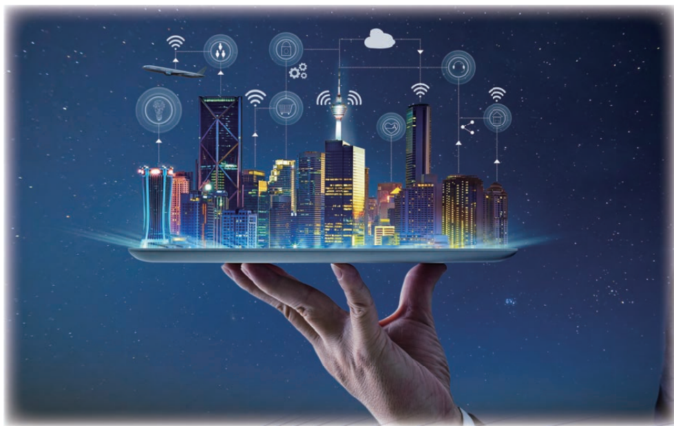
图8 数字孪生：物理世界的数字镜像

数字孪生对6G网络的架构和能力提出了诸多挑战，需要6G网络拥有万亿级的设备连接能力并满足亚毫秒级的时延要求，以便能够精确实时地捕捉物理世界的细微变化。通过网络数据模型和标准接口并辅以自