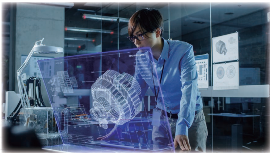
图3 全息通信：身临其境的极致体验

交互式全息显示需要足够快的全息图像传输能力和强大的空间三维显示能力。以传送原始像素尺寸为1920×1080×50的3D目标数据为例[3]，RGB数据为24 bit，刷新频率60 fps，需要峰值吞吐量约为149.3 Gbps，按照压缩比100计算，平均吞吐量需求约为1.5 Gbps。由于用户在全方位、多角度的全息交互中需要同时承载上千个并发数据流，由此推断用户吞吐量则需要至少达到Tbps量级。对于全息通信应用于“数字人”的靶向治疗、远程显微手术等特殊场景，由于信息的丢失意味着系统可靠性的降低，且为满足时延要求，传输的数据通常不可以选择重传，所以要求数据传输具有超高安全性和可靠性。