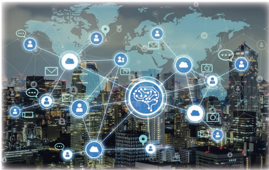
图7 普惠智能：无处不在的智慧内核

AI应用的本质就是通过不断增强的算力对大数据中蕴含的价值进行充分挖掘与持续学习的过程，从6G时代开始，网络自学习、自运行、自维护都将构建在AI和机器学习能力之上。网络自身就像一个“棋圣”，能够从容应对各种实时的变化。6G网络将