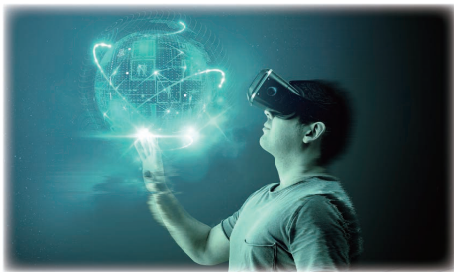
图2 沉浸式云XR：虚拟空间的广阔天地

未来云化XR系统将实现用户和环境的语音交互、手势交互、头部交互、眼球交互等复杂业务，需要在相对确定的系统环境下，满足超低时延与超高带宽才能为用户带来极致体验。现有的云VR系统对MTP 1 时延