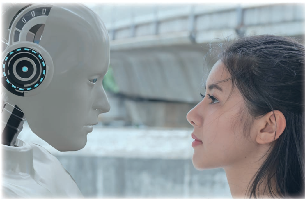
图5 智慧交互：情感思维的互通互动

在智慧交互场景中，智能体将产生主动的智慧交互行为，同时可以实现情感判断与反馈智能，因此，数据处理量将会大幅增加。为了实现智能体对于人类的实时交互与反馈，传输时延要小于1ms[4]，用户体验速率将大于10Gbps[5]；6G智慧交互应用场景，将融合语音、人脸、手势、生理信号等多种信息，人类思维理解、情境理解能力也将更加完善，可靠性指标需要进一步提高到99.99999%[6]。