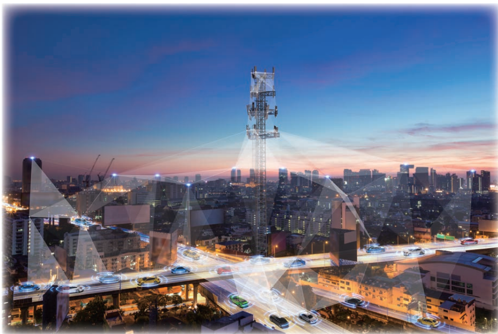
图 6 通信感知：融合通信的功能拓展

分辨率的图像，在完成环境重构的同时，实现厘米级的定位精度，从而实现构筑虚拟城市、智慧城市的愿景。基于无线信号构建的传感网络可以代替易受光和云层影响的激光雷达和摄像机，获得全天候的高传感分辨率和检测概率，实现通过感知来细分行人、自行车和婴儿车等周围环境物体。为实现机器人之间的协作、无接触手势操控、人体动作识别等应用，需要达到毫米级的方位感知精度，精确感知用户的运动状态，实现为用户提供高精度实时感知服务的目的。此外，环境污染源、空气含量监测和颗粒物（如PM2.5）成分分析等也可以通过更高频段的感知来实现。