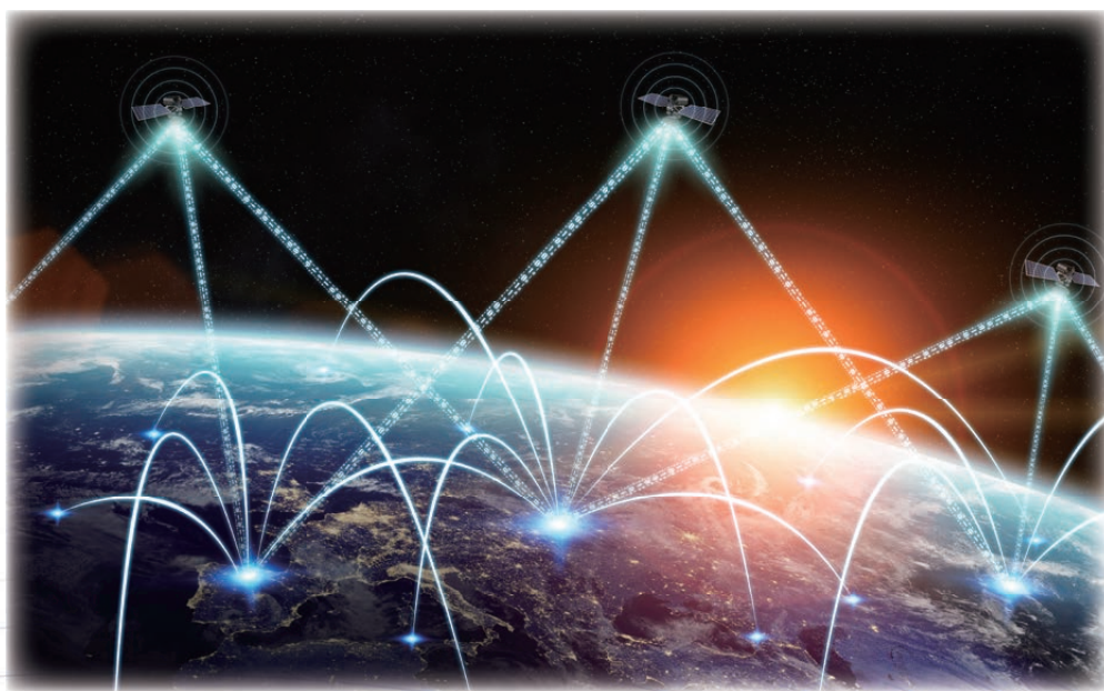
图9 全域覆盖：无缝立体的超级连接

全域覆盖将实现全时全地域的宽带接入能力，为偏远地区、飞机、无人机、汽车、轮船等提供宽带接入服务；为全球没有地面网络覆盖的地区提供广域物联网接入，保障应急通信、农作物监控、珍稀动物无人区监控、海上浮标信息收集、远洋集装箱信息收集等服务；提供精度为厘米级的高精度定位，实现高精度导航、精准农业等服务；此外，通过高精度地球表面成像，可实现应急救援、交通调度等服务。